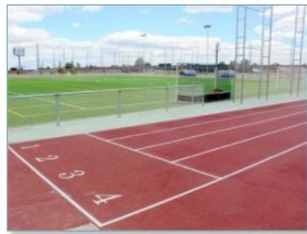
Pista de atletismo