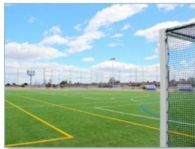
Campo de fútbol