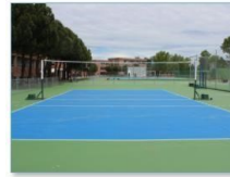
Pista de voleibol