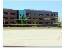
Pista de waterpolo

La distribución de los m 2 , del centro Deportivo, es la que se presenta a continuación, distribuidos en seis plantas: