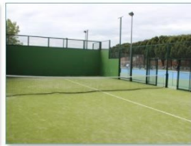
Pista de pádel