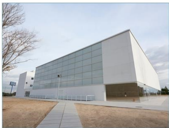
Centro deportivo UFV

Todos los programas y software incluidos en los diferentes espacios descritos son de uso docente, educativo y para la práctica de los alumnos. Véase: Macromedia, Adobe, Office, Quarxpress, Proyect y Frontpage, Suite de Adobe, Protools