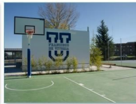
Cancha de baloncesto