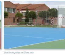
Una de las pistas de fútbol sala