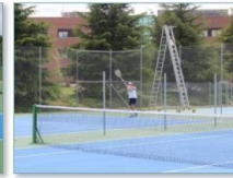
Pistas de tenis